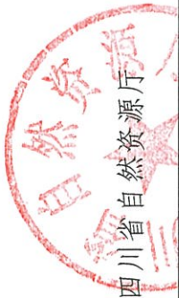
2022年度行政强制执行实施情况统计表